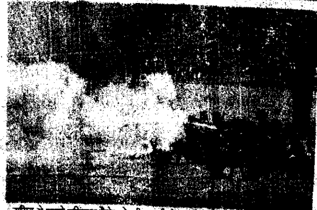
समिट से पहले बकिंगहम पैलेस के ग्रीन पार्क में 53 तोपों की सलामी की गई।

कॉमनवेल्थ 53 देशों का समूह है। इसके सदस्य देशों की आबादी 2 अरब 40 करोड़ से ज्यादा है। इसमें वे देश शामिल हैं, जो आजादी के पहले ब्रिटेन के अधीन थे। कुछ सदस्य देशों अपवाद भी हैं। फ्रेंचमा इन्होंने देशों के बीच चर्चा का एक मंच है। वे ब्रिटेन हर दो साल में एक बार होती है। हर बार अलग-अलग देशों में होती है। पहली बार 1971 में सिंगापुर हुई थी।