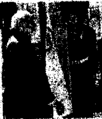
प्रधानमंत्री नरेंद्र मोदी पहली बार इस समिट में मौजूद रहे।

लंदन | प्रधानमंत्री नरेंद्र मोदी ने शुक्रवार को कॉमनवेल्थ देशों के राष्ट्राध्यक्षों की बैठक (चोगम) में हिस्सा लिया। समिट में कॉमनवेल्थ के 53 सदस्य देशों में से 46 के हेड ऑफ स्टेट मौजूद रहे। मोदी का ब्रिटेन की पीएम थैरेसा मे और कॉमनवेल्थ की महासचिव पैट्रीसिया स्कॉटलैंड ने स्वागत किया। समिट में भारत के प्रधानमंत्री ने 8 साल बाद हिस्सा लिया। बर्किंगहम पैलेस में सम्मेलन का आगमन क्वीन एलिजाबेथ द्वितीय ने किया। बोलीं - मैं सभी नेताओं का अपने घर में स्वागत करती हूँ। आपसे अपील करती हूँ कि वे मेरे बेटे प्रिंस चार्ल्स को मेरा उत्तराधिकारी चुनें। ताकि प्रिंस चार्ल्स मेरे पिता द्वारा शुरू किए इस महत्वपूर्ण काम को संभाल सके, मेरी उन्हें शुभकामना।