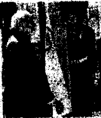
प्रधानमंत्री नरेंद्र मोदी पहले बार इस समिट में मौजूद रहे।

लंदन | प्रधानमंत्री नरेंद्र मोदी ने गुरुवार को कॉमनवेल्थ देशों के राष्ट्राध्यक्षों की बैठक (चोगम) में हिस्सा लिया। समिट में कॉमनवेल्थ के 53 सदस्य देशों में से 46 के हेड ऑफ स्टेट मौजूद रहे। मोदी का ब्रिटेन की पीएम थैरेसा मे और कॉमनवेल्थ की महासचिव पैट्रीसिया स्कॉटलैंड ने स्वागत किया। समिट में भारत के प्रधानमंत्री ने 8 साल बाद हिस्सा लिया। बर्किंगहम पैलेस में सम्मेलन का आगमन क्वीन एलिजाबेथ द्वितीय ने किया। बोलीं- मैं सभी नेताओं का अपने घर में स्वागत करती हूँ। आपसे अपील करती हूँ कि वे मेरे बेटे प्रिंस चार्ल्स को मेरा उत्तराधिकारी चुनें। ताकि प्रिंस चार्ल्स मेरे पिता द्वारा शुरू किए इस महत्वपूर्ण काम को संभाल सके, मेरी उन्हें शुभकामना।